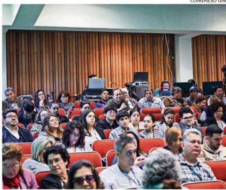
REPRESENTANTES DE DIVERSOS PAÍSES ASISTEN A LAS ACTIVIDADES.