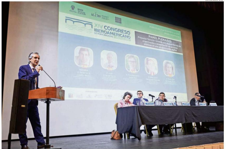
PANEL PLENARIO FUE PARTE DE LAS ACTIVIDADES DESARROLLADAS AYER EN EL TEATRO MUNICIPAL LORD COCHRANE.

En esa línea aclaró que transformar digitalmente la administración no es digitalizar la burocracia, "no se trata de que